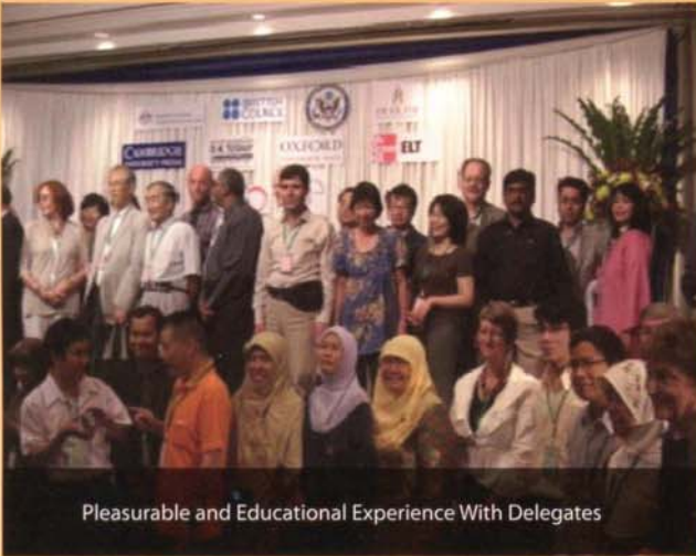
Pleasurable and Educational Experience With Delegates