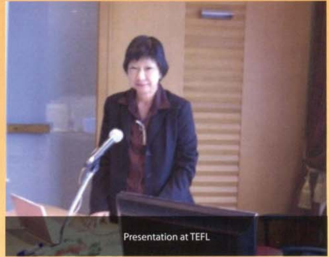
Presentation at TEFL

juga akan menjadi pusat rujukan untuk bahasa-bahasa ASEAN pada masa akan datang.